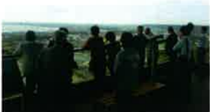
飯岡刑部岬展望館より

<3.11>東日本大震災から半年が経過した9月27日(火)、旭市商工会に訪問し被災地旭市飯岡地区を視察しました。