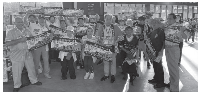
写真：鎌ヶ谷デーにて