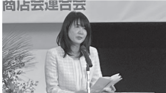
来賓挨拶：芝田市長