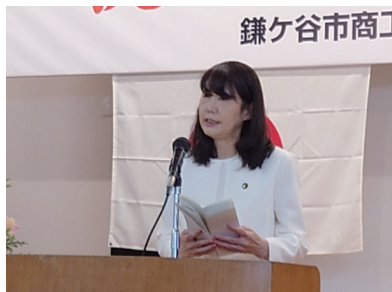
来賓挨拶：芝田市長