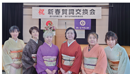
受付：女性部の皆さん