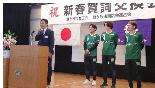
鎌ケ谷発のサッカーチーム 「FSV Kamagaya 2020」のご紹介